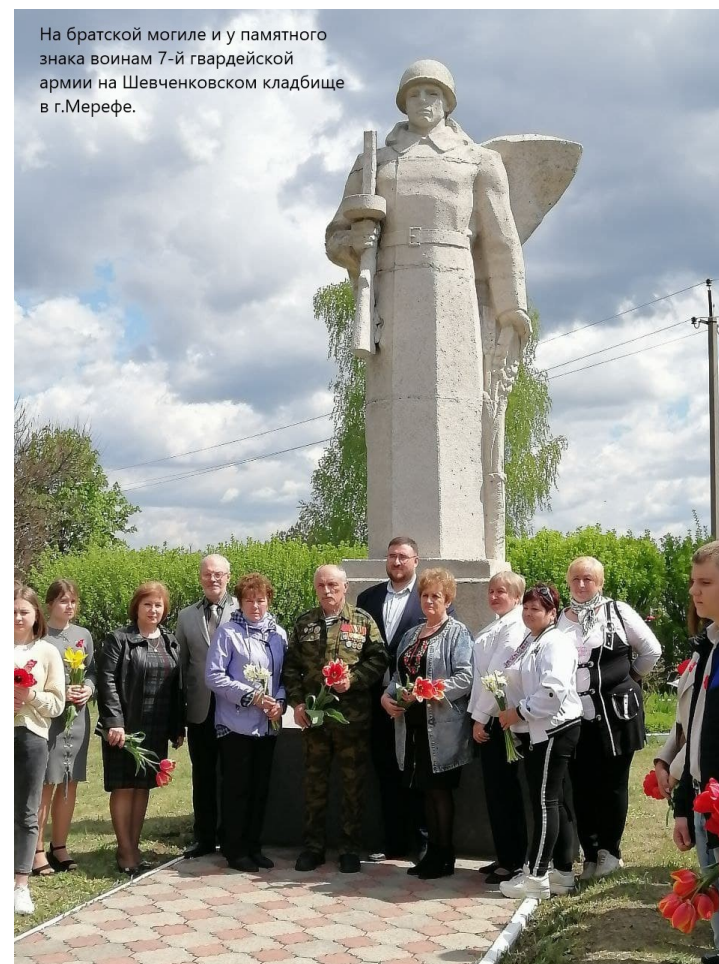
На братской могиле и у памятного знака воинам 7-й гвардейской армии на Шевченковском кладбище в г.Мерефе.

Особо памятным моментом стало возложение цветов на городском кладбище в г. Мерефа совместно с местными жителями этого населенного пункта. Эта церемония явилась свидетельством того, что наша общая память, наша общая история одинаково ценна для украинского и русского народов.