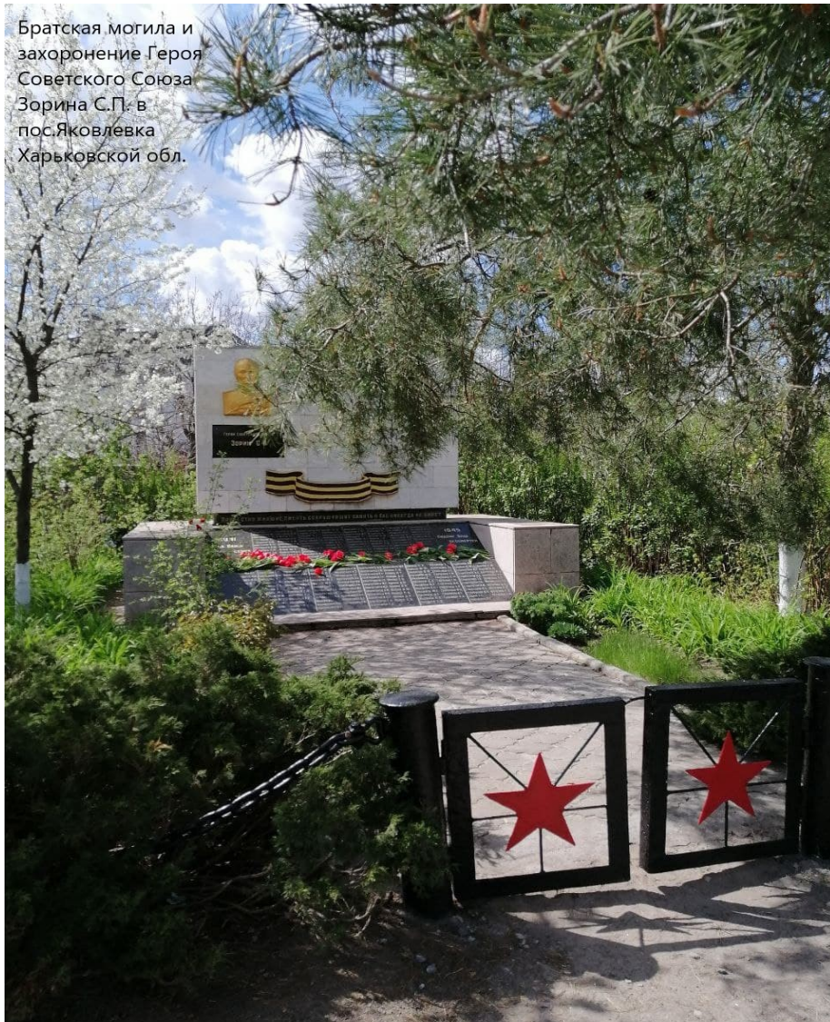
Братская могила и захоронение Героя Советского Союза Зорина С.П. в пос.Яковлевка Харьковской обл.