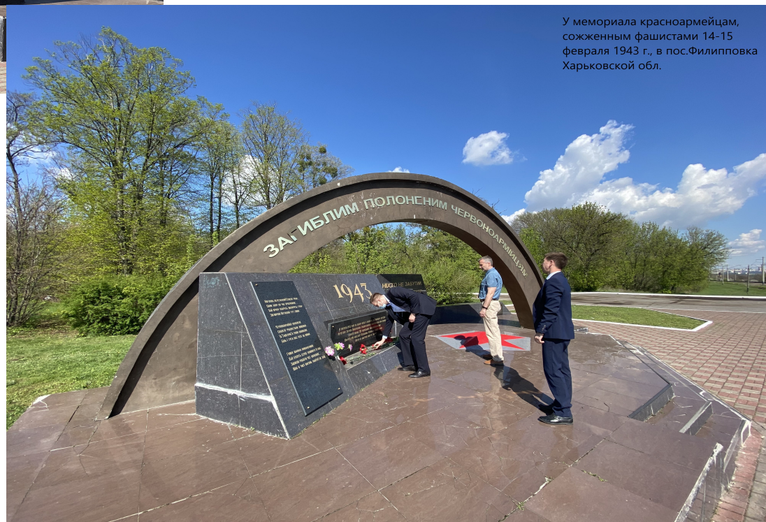
У мемориала красноармейцам, сожженным фашистами 14-15 февраля 1943 г., в пос. Филипповка Харьковской обл.