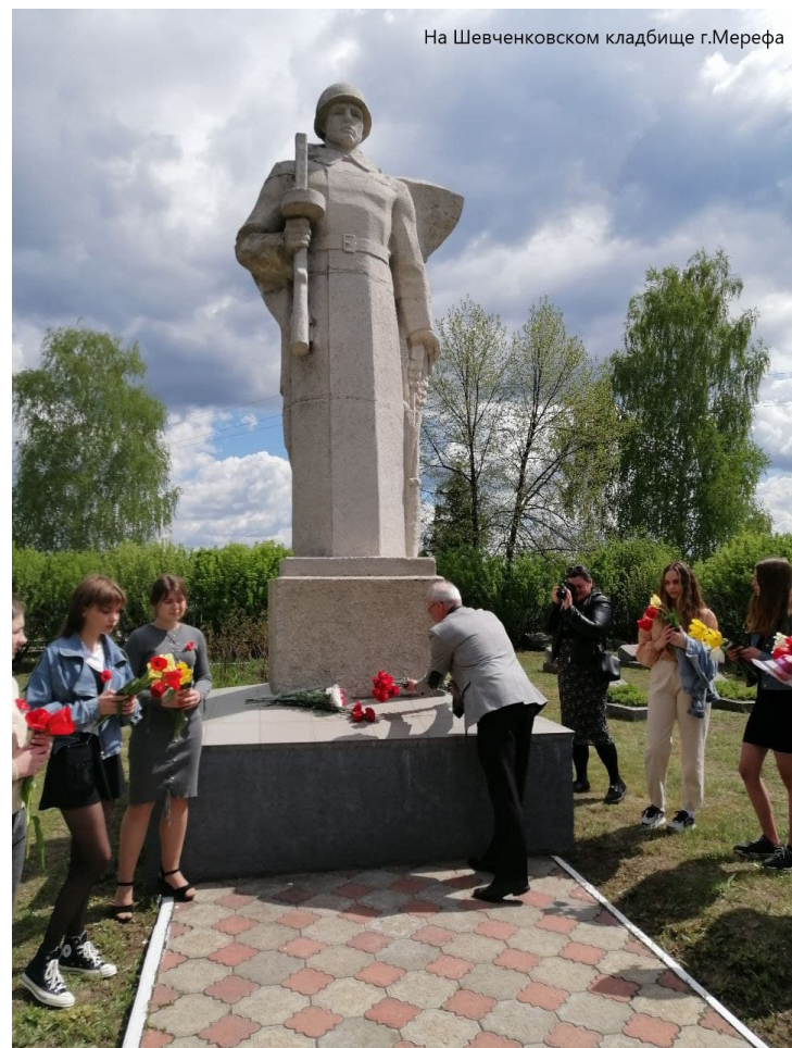
На Шевченковском кладбище г.Мерефа